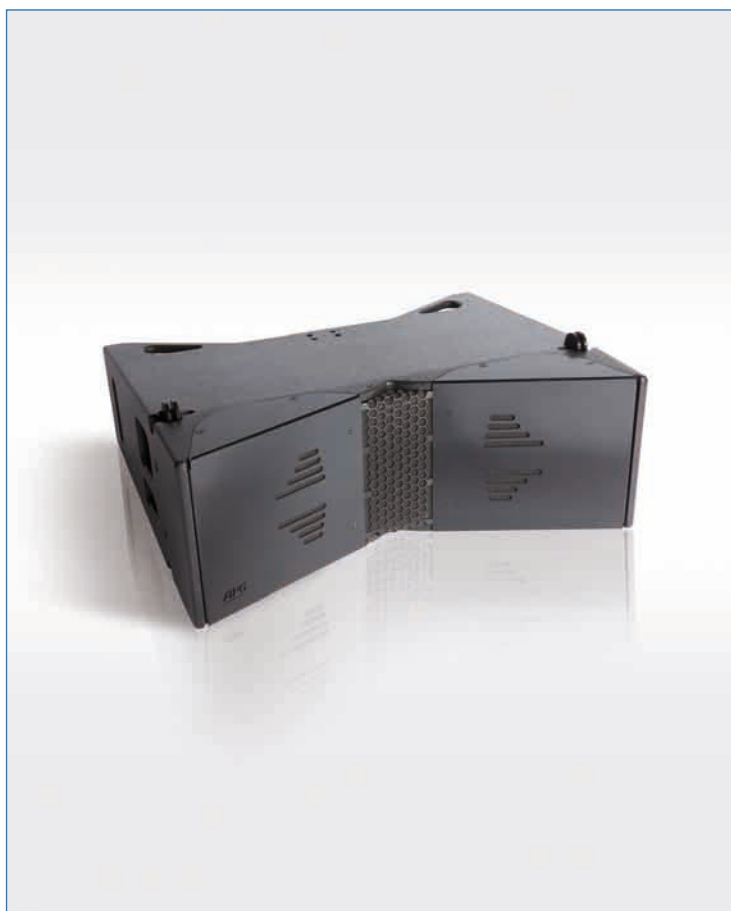
Enceinte Uniline type « Downfill » UL210D

L'enceinte UL210D est destinée à assurer le complément en champ proche de diffusion des grappes d'UL210 (enceintes principales du système UNILINE). Les enceintes UL210D sont conçues pour la diffusion de courte et moyenne portée, pour le mode « Down fill » quand elles sont accrochées en bas de grappe et enfin pour le mode « Front fill » quand elles sont disposées en nez de scène ou en bord de scène.